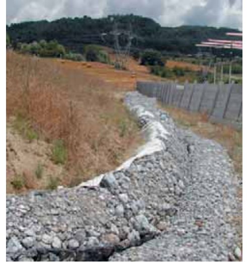
Intervento precedente al piede del versante

Nel cantiere in oggetto le trincee drenanti sono state realizzate secondo le linee di massima pendenza del versante con un interasse pari a circa 10 m, ricorrendo all'impiego di un geocomposito drenante tipo Enkadrain® 5006H costituito da due non tessuti termosaldati filtranti che racchiudono una struttura tridimensionale in polipropilene ad elevato indice di vuoti caratterizzato da un'elevata capacità drenante ai valori di carico tipici di queste applicazioni.