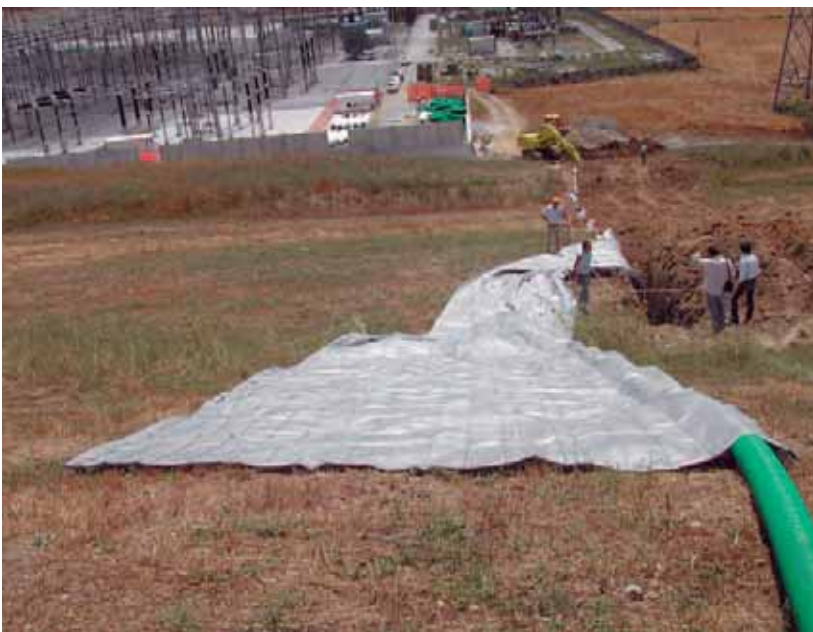
Fasi di posa