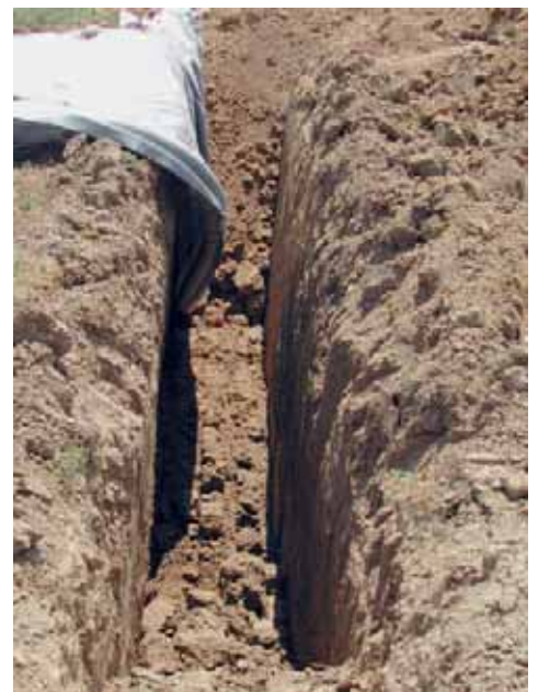
Scavo a sezione ristretta