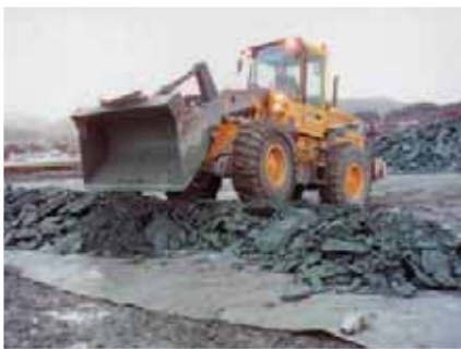
L'aggressione meccanica subita dal materiale

Nell'utilizzo di non tessuti Filtro Separatori il Typar® SF si contraddistingue per le particolari prestazioni meccaniche, che lo rendono idoneo agli impieghi più estremi. In particolare è possibile quantificare la quantità di energia che il materiale può accumulare, valore particolarmente utile poiché è possibile rilevare da esso il livello di resistenza al danno del materiale ossia la sua funzionalità nel tempo.