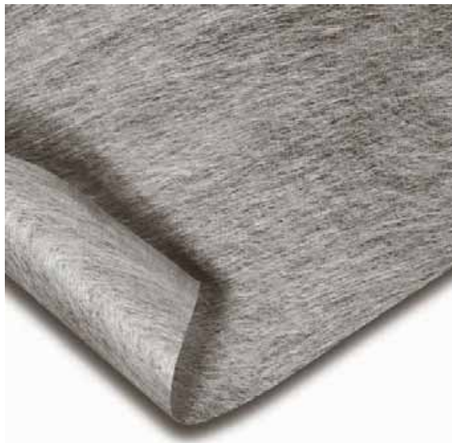
Come si presenta il Typar® SF

Nel dettaglio, e come rilevabile nella sottostante tabella, il Typar® SF 40 è in grado di accumulare un'energia di 3,7 kJ/mq prima di giungere a rottura ed è in grado di mantenere il 100% delle prestazioni originali anche se viene a contatto con acidi, basi, ossidi (Norma PrEN ISO 13438) e agli attacchi microbiologici (Norma EN 12225).