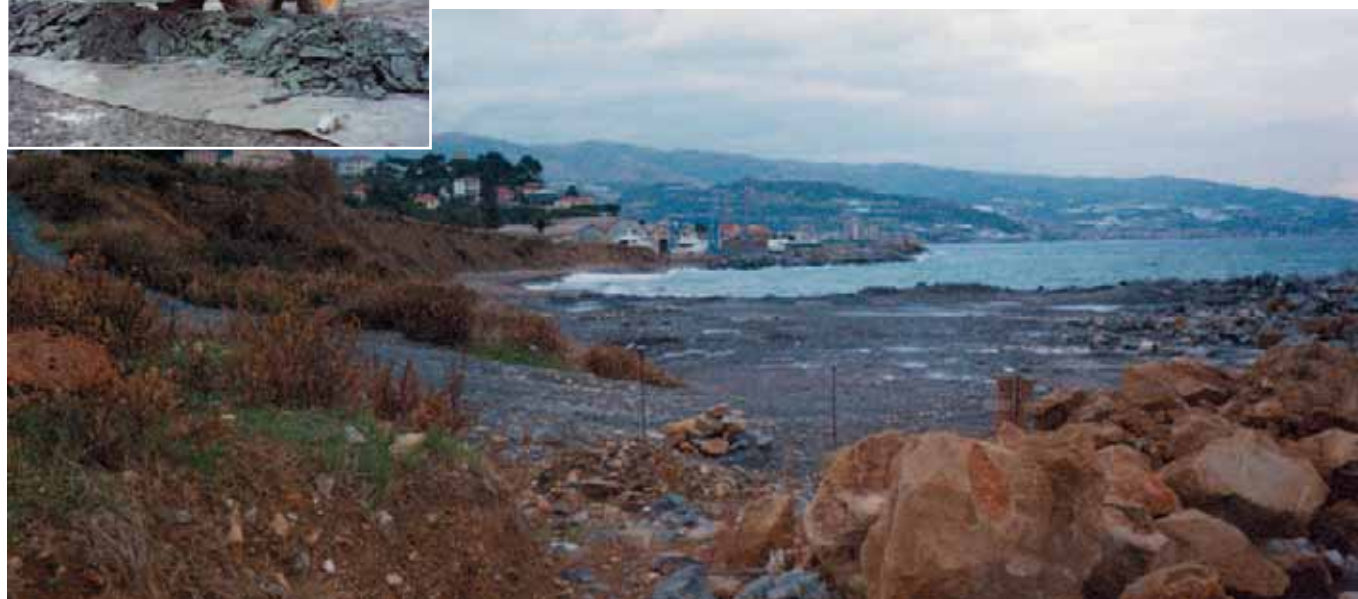
L'area di intervento prima della posa

Graphart - Design APG Trieste - 1.500 - 09/05