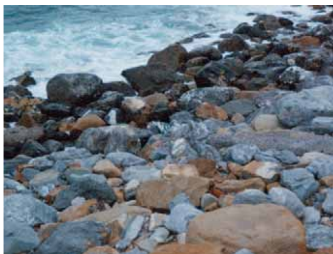
L'area di intervento dopo la posa