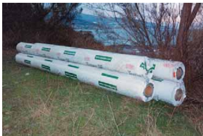
I rotoli di Typar® in cantiere